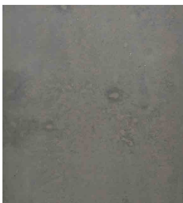
Rezept 472 SCC Farbe 5% dunkel