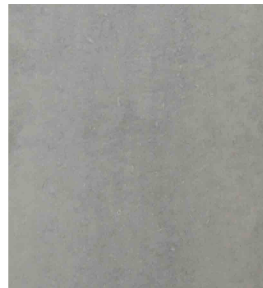
Rezept 220 SB Farbe 5% Hell