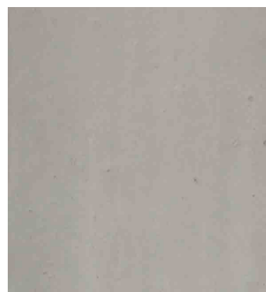
Rezept 462 SCC Farbe 5% hell