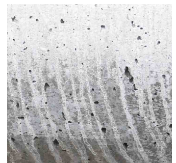
lange Zeit der Witterung ausgesetzt (1 Monat)