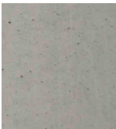
Rezept 452 SCC Farbe Natur