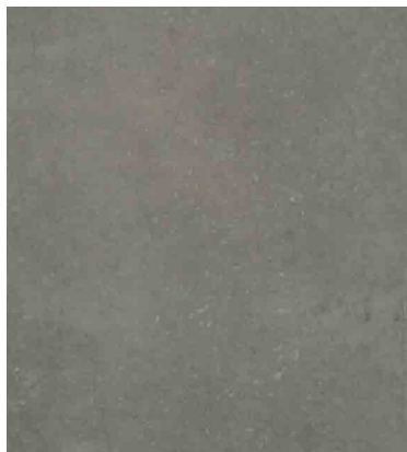
Rezept 219 SB Farbe Natur