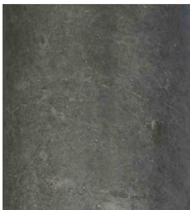
Rezept 230 SB Farbe 5% dunkel