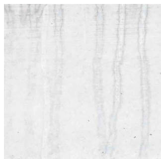
kurze Zeit der Witterung ausgesetzt