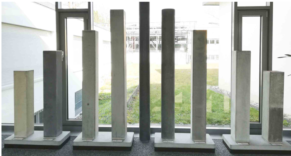
SIA-118/262:2018 Tabelle 6 Anforderungen an die Schalhaut *2

SACAC schliesst sich der Empfehlung der SIA-118/262 an. Auf Kundenwunsch kann ein projekt-spezifisches Musterelement offeriert und hergestellt werden. In unserem Showroom erhalten Sie einen Überblick über die häufigsten Ausführungsvarianten. Verschiedene Fasen, Herstellungsmethoden, Oberflächen und Farben können verglichen und bemustert werden. Gerne laden wir Sie ein, auch unsere Produktion zu besichtigen. Eine Übersicht über die verschiedenen Oberflächen-Farben bieten wir Ihnen zudem auf der Seite 5 dieses Dokuments.